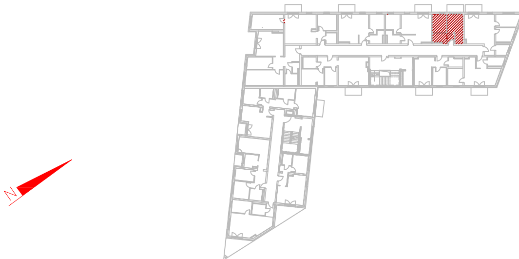
LOKALIZACJA LOKALU W BUDYNKU

Oświadczam, że lokal spełnia wszystkie wymogi techniczne wskazane w przepisach określających warunki jakim powinny odpowiadać lokale przeznaczone na stały pobyt ludzi.